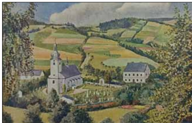
Sobotínský kostelíček. Pole vedou až na Svobodín. Cesta vedla až k prostoru k lomu na mastek (později „Sokolka“). Rok 1927