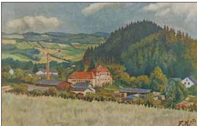
Ozdravovna diakonistek v Sobotíně. Dole je zachycena pila, nalevo jsou železářny a vpravo je štít tzv. „myslivecké chalupy“ Nahoře jsou jednotlivé polnosti. Rok 1927