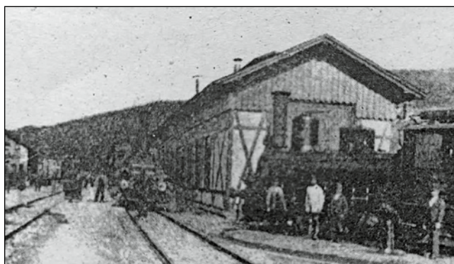
Sobotínské nádraží, rok 1900