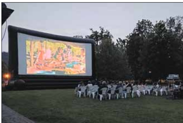
Venkovní promítání pro děti

V pátek 3. června 2022 proběhlo venkovní promítání ke Dni dětí. Promítal se film „ Mazel a tajemství lesa “. Dětem se tento český dobrodružný film moc líbil. Jsme rádi, že vyšlo počasí a byla dobrá účast. Děkujeme.