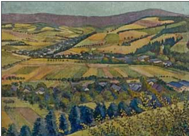
Pohled na sobotínské údolí ze Stráže (Hohe Warte), který zachycuje Štětínov (dole), mauzoleum a celkové okolí naší obce. Rok 1927