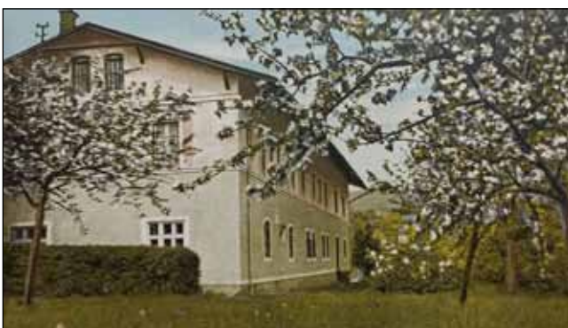
Hlavní budova ozdraven – číslo 1- se nazývala „Četnický dům“. Původně sloužila k ubytování mistrům a dílovedoucím sobotínských železáren. V roce 1927 tuto budovu získala pro celoroční provoz Olomoucké ozdravovny. V pozdních letech se nacházely řecké domovy a internát zvláštní školy. V roce 1998 získal budovu obecní úřad a vybudoval „Dům s pečovatelskou službou.“ Rok 1927