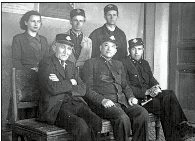
Zaměstnanci železniční stanice Sobotín, rok 1945