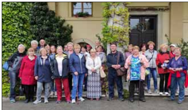
Společná fotografie ze zájezdu seniorů – 17. 5. 2022

Další akcí byl zájezd seniorů , který byl uskutečněn dne 17. 5. 2022 . Jeli jsme na Opavsko, kde jsme jako první navštívili zámek Raduň . Tento renesanční zámek s pozdějšími empírovými úpravami nás překvapil již při prvním pohledu. „Je rozkošný.“ Je obklopen parkem na jedné straně a rybníkem na straně druhé. Rovněž uvnitř zámku se bylo na co dívat. Mimo velmi pěkných interiérů byl celý zámek plný roztomilých